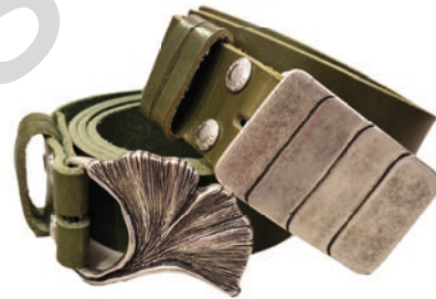
Edele Ledergürtel mit Wechselschnallen