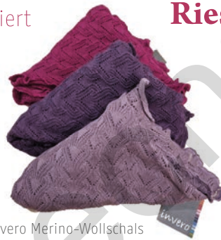
Invero Merino-Wollschals in den tollsten Herbstfarben