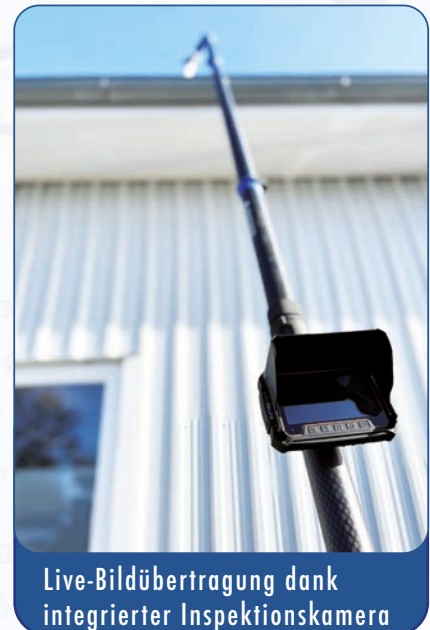
Live-Bildübertragung dank integrierter Inspektionskamera