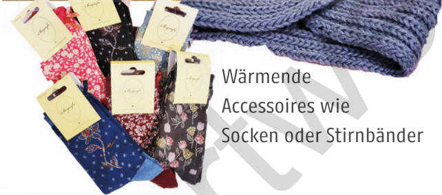
Wärmende Accessoires wie Socken oder Stirnbänder

Neben einem umfangreichen Angebot an Schals, dicken Pullovern, Mützen oder wärmenden Jacken enthält das Sortiment stilvolle Mode für das Fest.