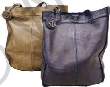
Harbour 2nd: große Auswahl an Ledertaschen und Geldbörsen

Zahlreiche zauberhafte, handgefertigte Geschenkideen, handgeschöpfte Kerzen, Grußkarten für jeden Anlass u.v.m.